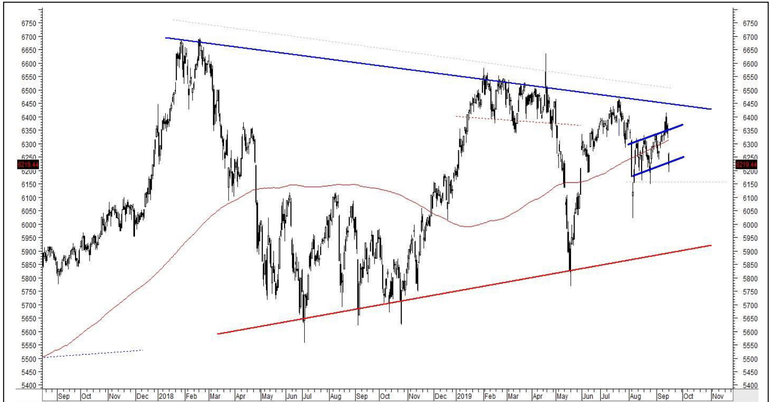
IDX – Daily